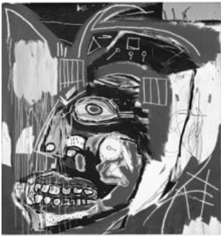
Basquiat’s painting titled In this case (1983) sold for a record price

There was record participation from Asian buyers, who accounted